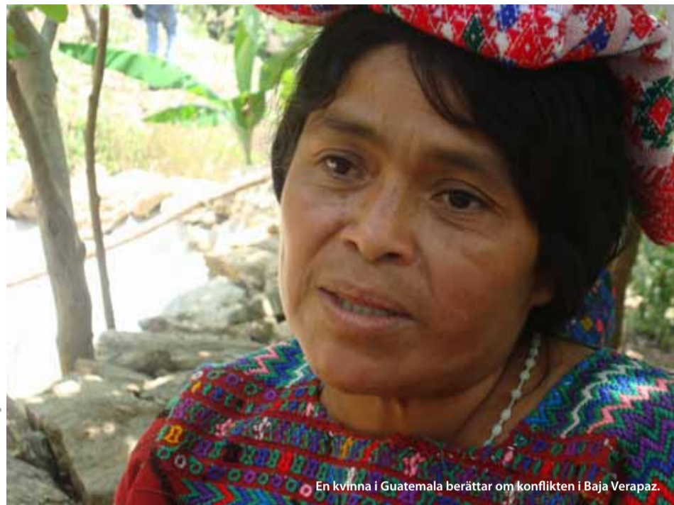
En kvinna i Guatemala berättar om konflikten i Baja Verapaz.

Även om det 36 år långa inbördeskriget tog slut redan 1996 är arbetet med att skapa rättvisa för offren långt ifrån över. FN:s utvecklingsprogram