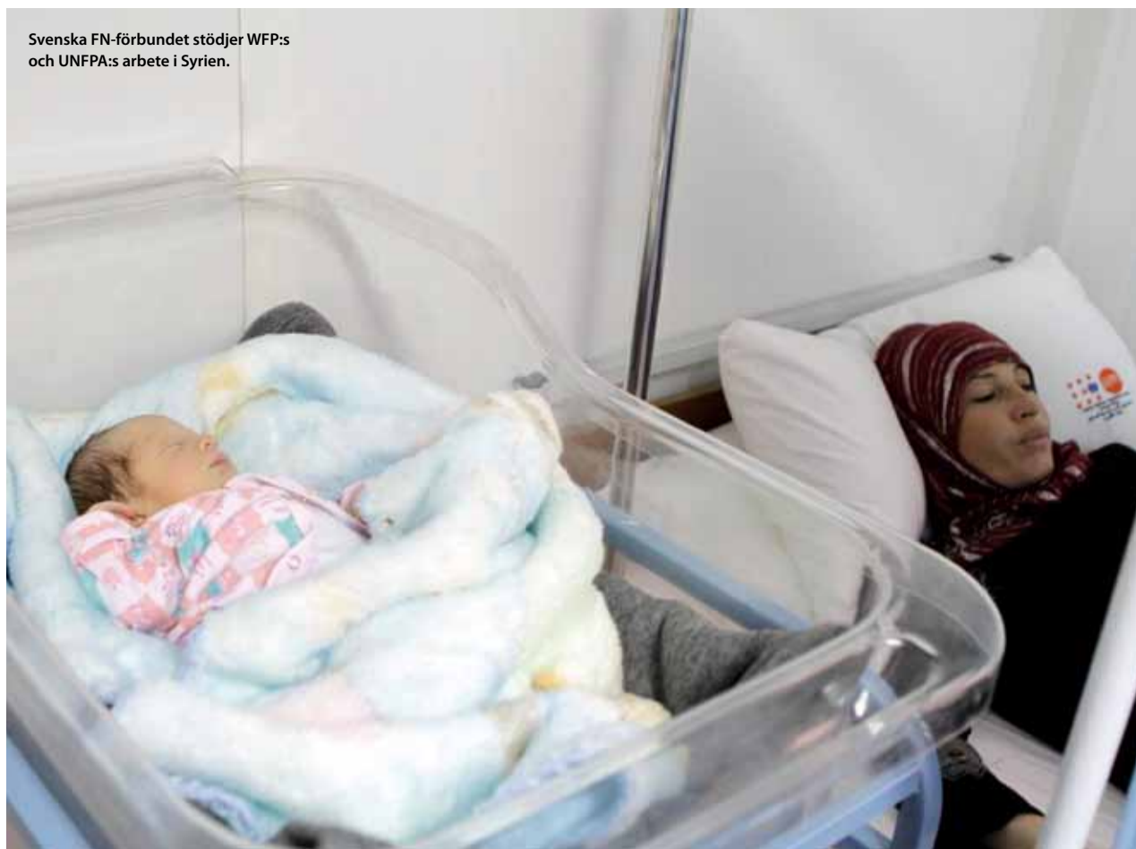
Svenska FN-förbundet stödjer WFP:s och UNFPA:s arbete i Syrien.