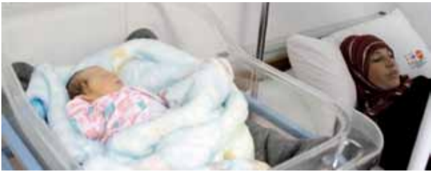
Säkra födlsar i flyktingläger