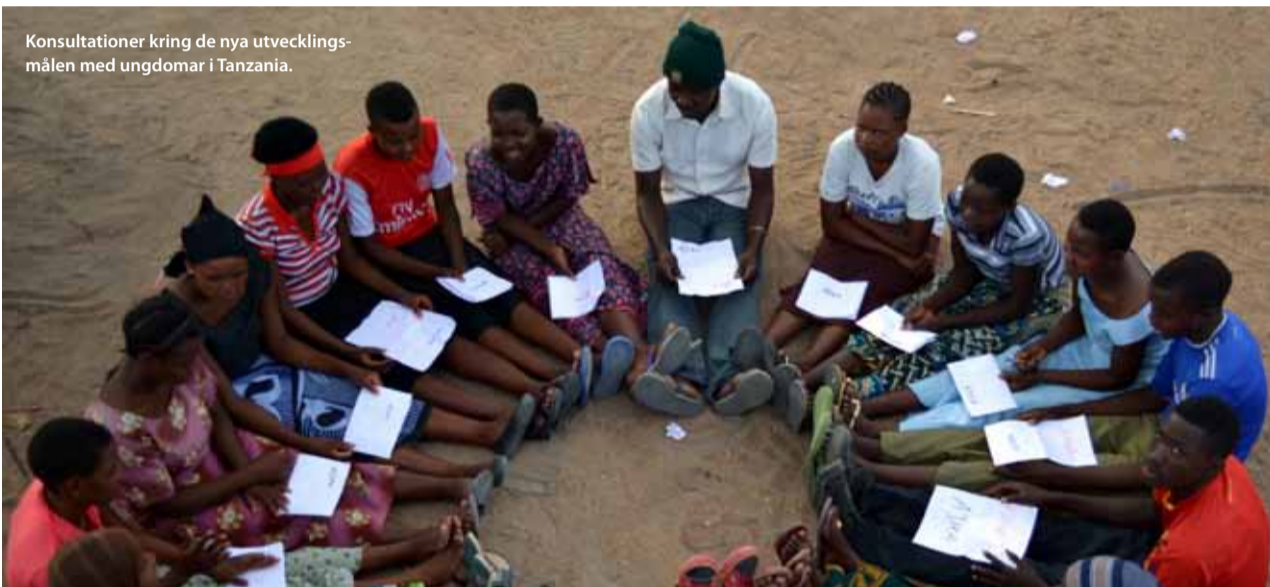
Konsultationer kring de nya utvecklingsmålen med ungdomar i Tanzania.