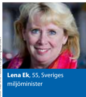
Lena Ek, 55 , Sveriges miljöminister

”Lyckas vi inte förhindra den globala temperaturökningen kommer det exempelvis leda till fler översvämningar och svårare torkkatastrofer, vilket i sin tur drabbar människorna på den fattiga delen av jordklotet hårdast. Därför går kampen för att rädda klimatet hand i hand med kampen mot fattigdom och ohälsa”.