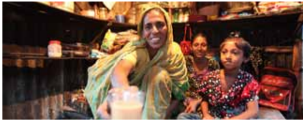
Från utblottad till framgångsrik företagare