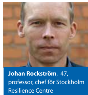
Johan Rockström, 47 , professor, chef för Stockholm Resilience Centre

”Att verkligen utgå från varje människas lika värde och okränkbara rättigheter. Det styr hur vi tänker när det gäller hälsa, utbildning, jämställdhet, ekonomiska förutsättningar, ekosystem och klimatförändringar”.